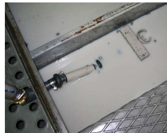
MOT-Schwimmer für hohe Spananteile