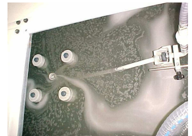
Schwimmer für grosse Emulsionsbecken.