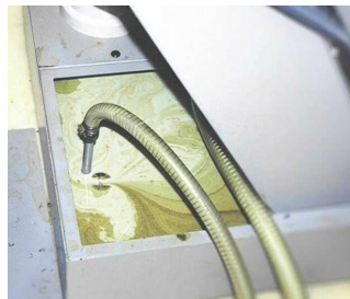
Schnorchelschwimmer für sehr kleine Öffnungen im Emulsionsbecken